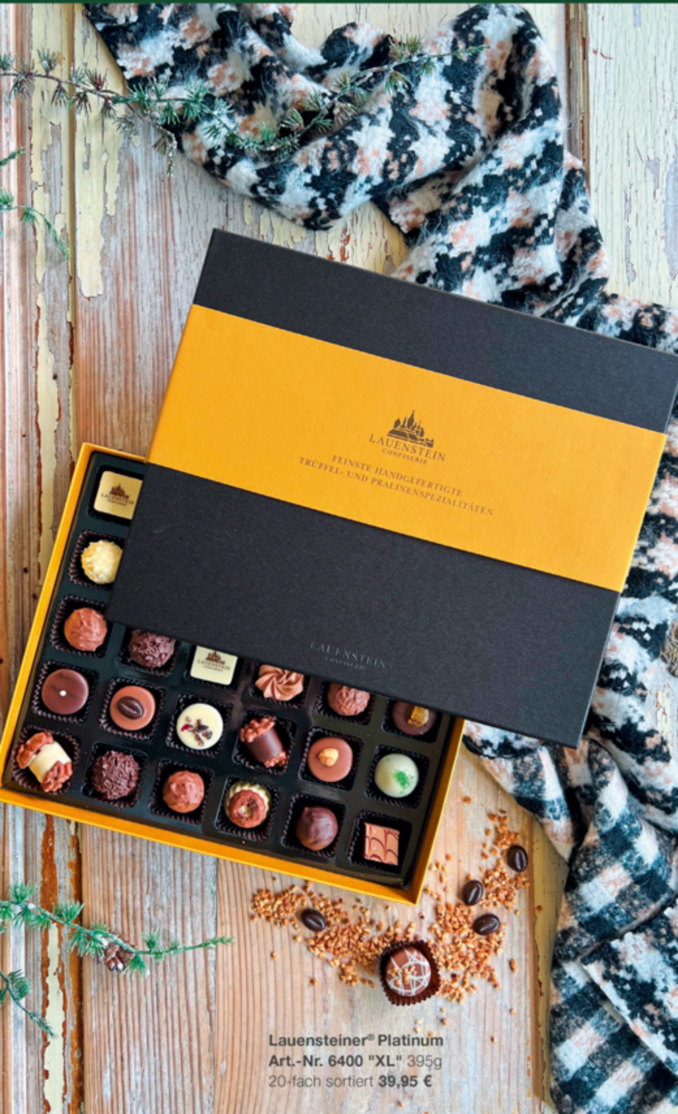
Lauensteiner® Platinum Art.-Nr. 6400 "XL" 395g 20-fach sortiert 39,95 €