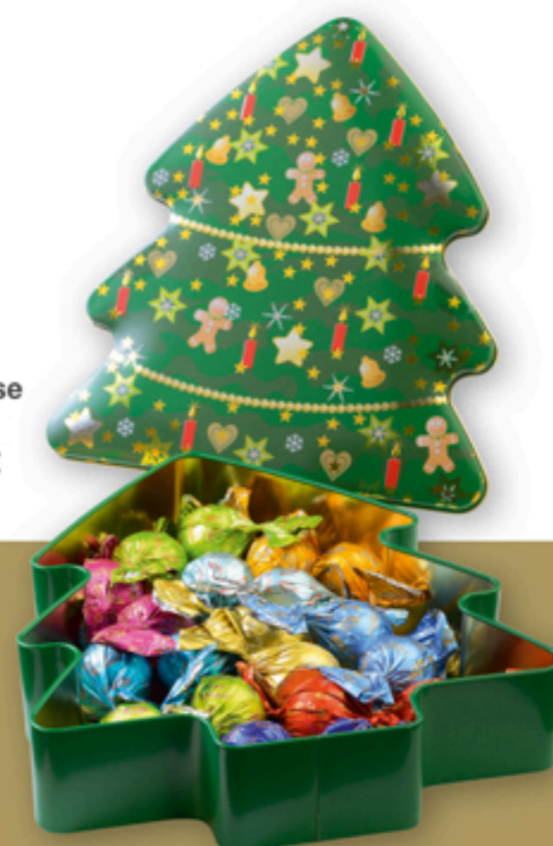
Lauensteiner® Weihnachtsbaum-Dose Art.-Nr. 5597 250g 10-fach sortiert 20,95 €

Lassen Sie Ihr Herz berühren und finden Sie Inspirationen auf lauensteiner.de .