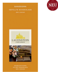
Lauensteiner Gefüllte Tafelschokolade - Sanddorn

Inhalt 80g | 38% Cacao | vollmilch Mit Alkohol